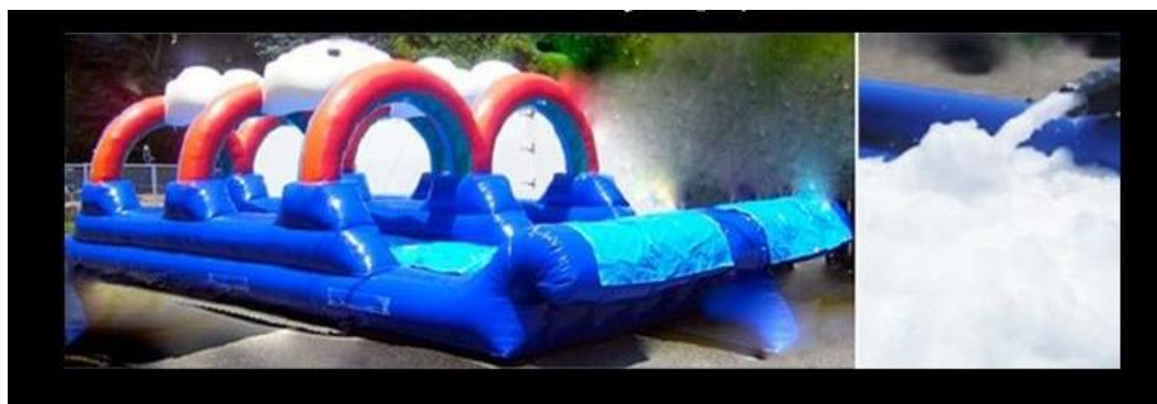
コース内にある障害物の一つ、バブルスライダー

「ヴァイキングアドベンチャー@幕張海浜公園」は、約5kmのコースに、 ロード、障害物、ビーチ、トレイル、の要素がある、エンターテインメントランニングイベント です。順位やタイム計測はありません。自分のペースで仲間と「楽しく走る！」ことを目的にしているので、スポーツが得意な方も、そうでない方も、気軽に参加できます。仲間とお気に入りのコスチュームを身にまとい、体いっぱい自然を感じながら、楽しい障害物に挑戦できます。ゴール後のエリアでは、素敵な音楽や食事、アルコールなどのドリンクも用意しています。音楽にあわせて踊り、よく食べよく飲み、仲間と一緒に楽しんでいただけます。